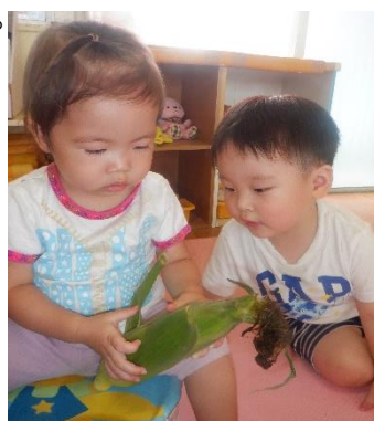
皮をむいてみよう