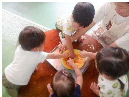
すいかを触ってみたよ

栽培活動は大きいクラスの子が主になって行いますが、小さいクラスの子たちも発達に合わせて食育活動を行っています。りんご組さんが実際に野菜に触れる活動を行ったので紹介します。