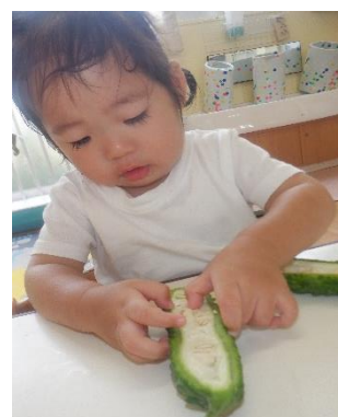
フワフワして気持ちいい

野菜を見たり触ったりし、匂いを嗅いで「くさい」と言った子もいました。スイカは、中身に実際に触れ果肉や果汁を目や感触や匂いからなど、味覚以外でも感じていました。調理前の食材に触れる機会があまりないので、興味津々の子どもたちでしたよ。乳児期に食に興味を持つことが、大きくなって「食べる事が楽しい！」という気持ちにつながっていくと思います。このような経験を大切にしていきたいです。